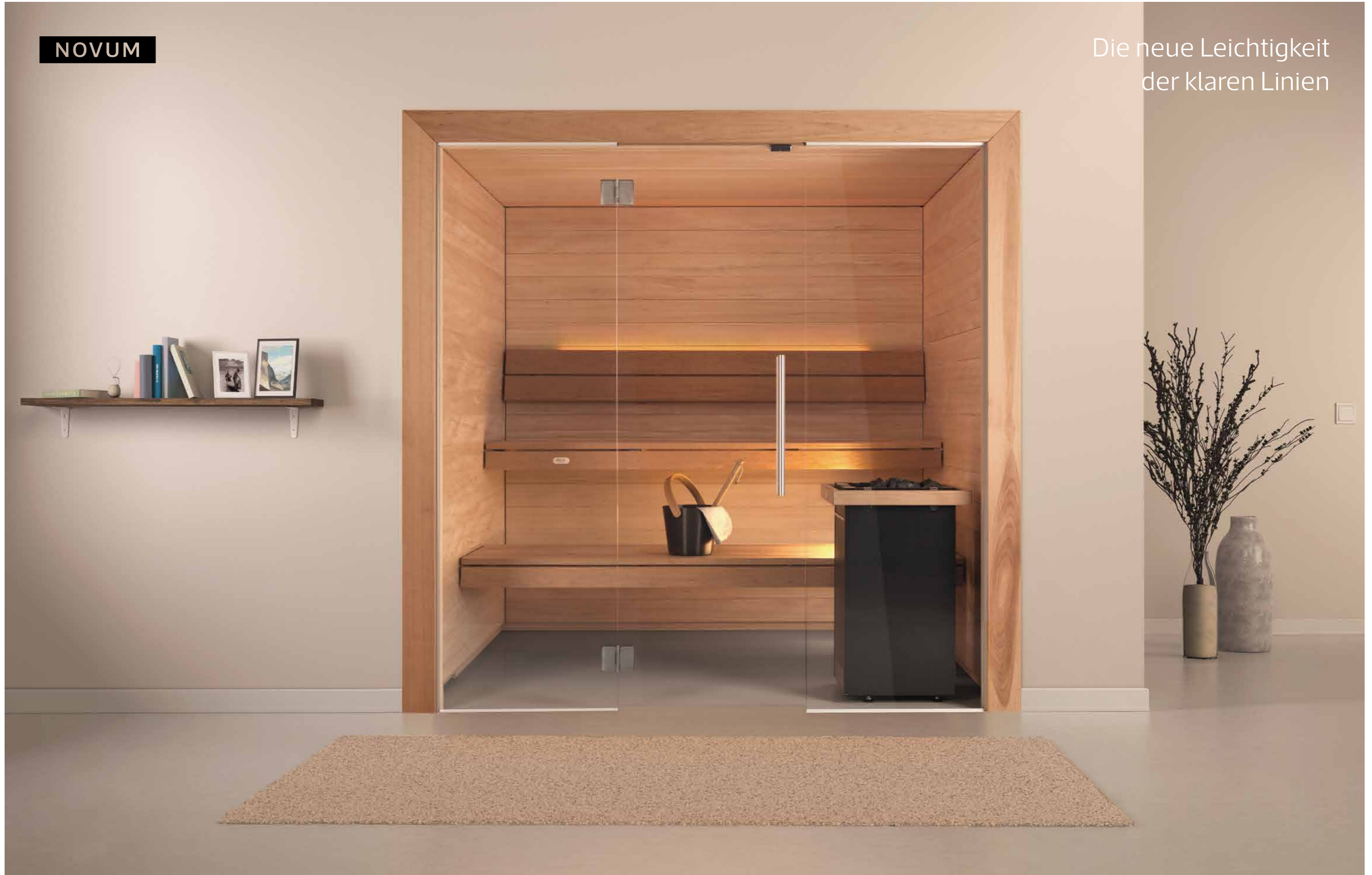
Viliv Novum mit Saunaofen ,Viliv Kvadrat'